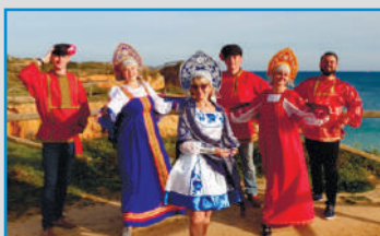
АССОЦИАЦИЯ «ЦПЭ ИЗ ВОСТОЧНОЙ ЕВРОПЫ И ДРУЗЬЯ» (Г. ПОРТИМАУ, ПОРТУГАЛЬСКАЯ РЕСПУБЛИКА)