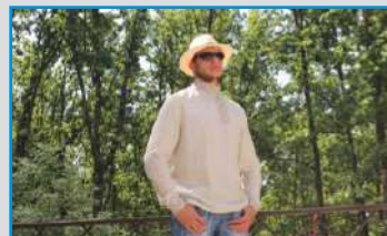
МАСТЕРСКАЯ «РУССКИЙ СТИЛЬ», (Г. НОВОСИБИРСК, РОССИЯ)