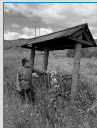
СТУДИЯ НАРОДНОГО КОСТЮМА «ВЕРЕТЕНЦЕ», (Д. КАМЕНКА НА РЕКЕ ЧУСОВОЙ, РОССИЯ)

БУДЬ С НАМИ 12 ИЮЛЯ 2022 ГОДА – НАДЕНЬ КОСОВОРОТКУ – ВСПОМНИ, ЧТО ТЫ – РУССКИЙ!